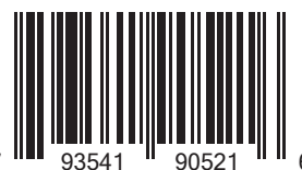
EAN 2,5 kg

Peso del paquete: 12 kg Paquetes por palet: 27 paquetes (9 capas x 3 paquetes) Dimensiones palet: 80 x 120 x 110h cm