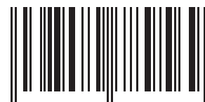
EAN 3 kg

Peso del paquete: 15 kg Paquetes por palet: 48 paquetes (16 capas x 3 paquetes) Dimensiones palet: 80 x 120 x 220h cm